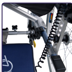
In hoek verstelbaar stuur